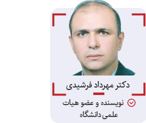
دکتر مهرداد قریشی

در آخرین مصاحبه معاونت محترم ساخت و توسعه راه آهن به عنوان مجری طرح ریلی چابهار - زاهدان، ایشان اعلام کردند که از ۵۵۰ میلیون یورویی که قرار بود از حساب صندوق توسعه ملی به این خط اختصاص یابد، تاکنون ۲۰۰ میلیون یورو پرداخت شده و علاوه بر ۳۵۰ میلیون یورویی باقی مانده، ۵۰۰۰ میلیارد تومان دیگر براساس ثبت در حساب دفتری هزینه شده، باید پرداخت گردد. اگر فرض را بر همین دو آیتیم مالی به عنوان کل هزینه پروژه مذکور بگذاریم، هزینه دریافت شده از سوی پیمانکار طرح حدود ۲۲ هزار میلیارد تومان می شود که اگر بر ۷۳۰ کیلومتر طول پروژه تقسیم