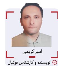
امیر کریمی نویسنده و کارشناس فوتبال