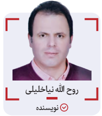
روح الله نیاخلیلی نویسنده