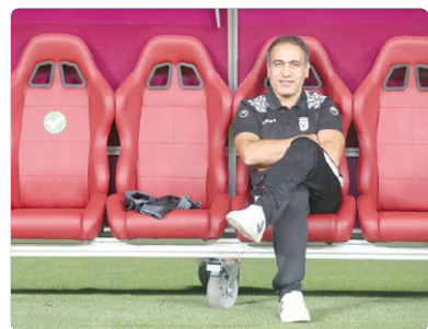
شنبه ۱۴ خرداد

ترکمنستان-ایران، ساعت ۱۶:۳۰، ورزشگاه بنیاد کار تاشکند سه‌شنبه ۱۷ خرداد ایران- ازبکستان، ساعت ۲۰:۳۰، ورزشگاه مرکزی قارشی