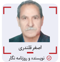
اصغر قلندری نویسنده و روزنامه نگار

بارها نوشتیم که علی‌رغم اطلاع مسئولان از پرداخت ورودی تیم‌ها در مسابقات قهرمانی کشور و پرداخت هزینه‌های ایاب و ذهاب توسط تیم‌های شرکت‌کننده و حضور در شرایط نامساعد با حواشی زیادی همراه گردیده و باعث نارضایتی تیم‌های شرکت‌کننده را به‌همراه داشته است و باعث گردیده ورزش، بویژه والیبالی از نظر کمیت و کیفیت، دچار افت فاحشی گردد و کمتر تیم‌هایی قادر به پرداخت چنین پول‌هایی هستند، ولی چه سود به گوش مسئولین وزارت ورزش نرسید که نرسید!