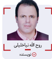
روح الله نیاخلیلی نویسنده

وقتی سه دهه از هزاره سیزدهم هجری را به سبب خاطره‌ها آویختیم، کرج را بلدی و ساکنان را نعمت شهری شدن حاصل آمد تا آنکه اندکی مانده به پایان هشتمین‌دهه همان قرن، مولود جدیدی بنام شورای شهر متولد شد. قریب به هفت‌دهه است که کرج شهردار دارد، پنج دهه انتصابی توسط وزارت کشور و دو دهه انتخابی توسط شورای شهر.