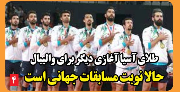
طایف آسیا آکازی دیگر برای والیبال حالا نوبت مسابقات جهانی است

«دنیای هوادار» به یاد روح قلم زنده یاد ناصر احمدپور منتشر می شود