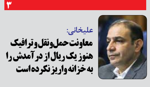
علیخانی: معاونت حمل و نقل و ترافیک هنوز یک ریال از درآمدها را به خزانه واریز نکرده است