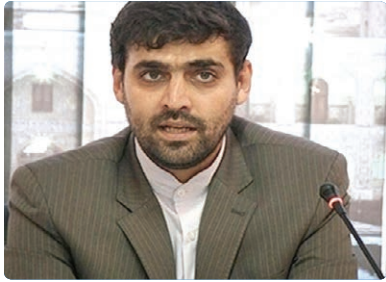
ارشاد اسلامی استان البرز بود که به با عنایت به پایان دوره خدمت خود به درجه بازنشستگی نائل شد.