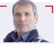
سیدرضا فیض آبادی نویسنده و روزنامه نگار