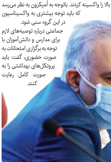
کرونا در ایران

وی گفت: باید توجه کرد که بسیاری از کشورها واکسیناسیون این سنین علیه کرونا را انجام دادند. به طوری که در چین از سه سالگی و در آمریکا از ۵ سال به