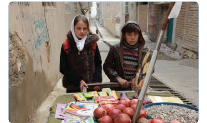
فیلم سینمایی «وقت چیغ انار» بعد از حضور موفق در چهاردهمین دوره جایزه سینمایی آسیاسیفیک