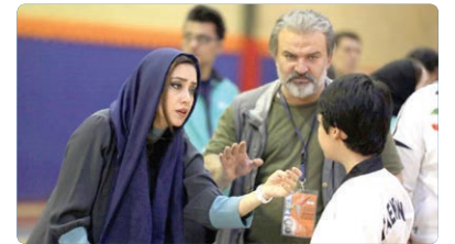
همزمان با برگزاری پنجاه و یکمین جشنواره بین‌المللی فیلم رشد، فیلم سینمایی مرد نقره‌ای به کارگردانی

مراسم اختتامیه پنجاه و یکمین جشنواره بین‌المللی فیلم رشد عصر روز جمعه ۲۴ آذرماه از ساعت ۱۸ تا ۲۱ در مجموعه فرهنگی سینما فلسطین برگزار خواهد شد.