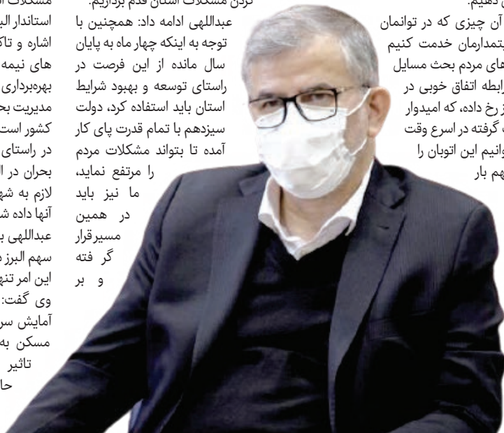
«مدیر کل آموزش و پرورش البرز» خبر داد:

عبداللهی ادامه داد: همچنین با توجه به اینکه چهار ماه به پایان سال مانده از این فرصت در راستای توسعه و بهبود شرایط استان باید استفاده کرد، دولت سیزدهم با تمام قدرت پای کار آمده تا بتواند مشکلات مردم را مرتفع نماید، ما نیز باید در همین مسیر قرار گرفته و بر