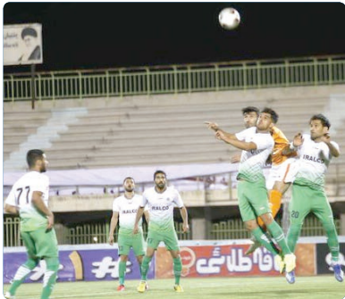
ماشین سازی و شاهین شهرداری بوشهر با یک امتیاز در قعر جدول قرار دارند.

نتیجه یک بر یک متوقف شد تا ۸ امتیازی شود. در دربی خوزستان، استقلال ملاثانی برابر استقلال خوزستان شکست خورد تا استقلال خوزستان نخستین پیروزی فصل خود را به دست بیاورد و سر و سامانی در جدول پیدا کند. تیم فوتبال مس شهر بابک موفق شد در دقایق پایانی با یک گل میزبان خود شمس آذر قزوین را شکست دهد. شهرداری آستارا برابر تیم ته جدولی شاهین شهرداری بوشهر با نتیجه یک بر صفر به پیروزی رسید تا ۱۰ امتیازی شود و به دلیل تفاضل گل کمتر نسبت به خیبر، در رده پنجم قرار بگیرد. در جدول رده بندی، قشقایی شیراز با ۱۲ امتیاز صدرنشین است و تیم های شهرداری همدان و ملوان انزلی با ۱۱ امتیاز در رده های بعدی قرار دارند. تیم فوتبال خیبر خرم آباد نیز به رده چهارم سقوط کرد. همچنین ۳ تیم پارس جنوبی،