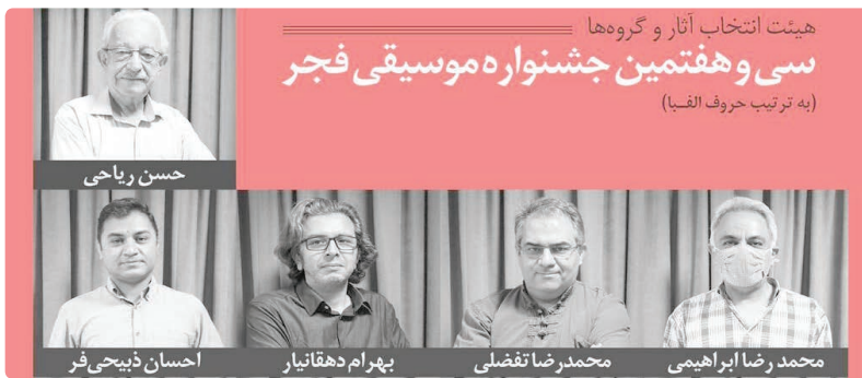
هیئت انتخاب آثار و گروه‌ها