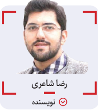
رضا شاعری نویسنده

به این عکس خوب نگاه کنید، صدای نفس نفس زدنش می آید، پهلوان پهلوان می ماند، نیم قرن است که هر کشتی گیر و هر قهرمانی در این دیار، فقط یک رقیب دارد و آن هم آقا تختی است، همان که پهلوان زنده مانده تاریخ معاصر ماست، که نه برای طلای المپیکش، بلکه برای دلی که از ملت ایران برده، به شمایل ابدی پهلوان تبدیل شده است. یعنی این جوان ها می توانند آقا تختی های نسل ما شوند؟