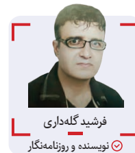
فرشید گله‌داری نویسنده و روزنامه‌نگار

در مورد معیار انتخاب همسر، ضرب‌المثل‌هایی در فرهنگ ما وجود دارد که در ضمن سادگی، بسیار پرمحتوا و آموزنده است؛ «کیبوتر با کیبوتر باز با باز»؛ بسیاری از جوانان، در دوره پیش از ازدواج به دلیل نداشتن تجربه و آموزش کافی، دچار برانگیختگی احساسات و عواطف می‌شوند و از خردمندی و دوراندیشی لازم در ازدواج چشم‌پوشی می‌کنند؛ بنابراین آن‌ها در این دوران سرنوشت ساز و حساس، خوشبینانه و ساده‌انگارانه، فقط به خوبی و برتری‌های فرد مقابل توجه دارند و امیدوارند اختلاف‌های به ظاهر کوچک، در زیر یک سقف از بین برود.