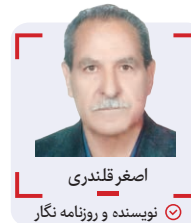
اصغر قلندری نویسنده و روزنامه نگار