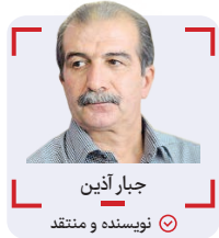
جبران آذین نویسنده و منتقد

درحالی که افق فرهنگ و هنر و به تبع آن سینما، همچنان ناروشن است و هیچ دورنمایی هم از سوی آقای رییس جمهور جدید، حتی در حد شعار، برای آن ارائه نشده است