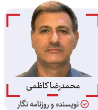
محمد رضا کاظمی نویسنده و روزنامه نگار

این روزها و با توجه به افول آفتاب عمر وزارت سلطانی‌فر در دستگاه ورزش، عده‌ای از خودی‌ها نیز به او پشت کرده و ساز مخالف کوک می‌کنند.