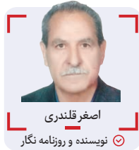
اصغر قلندری نویسنده و روزنامه نگار