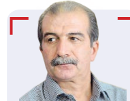
جبار آذین نویسنده و منتقد سینما

ابتدال‌گراها و رانده شدن ارزش‌ها و تخریب دستاوردها، به این حال و روز درآمده را بشناسید و با در دست داشتن برنامه‌ها و طرح‌های اجرایی هدفمند، عهده‌دار مقام وزارت ارشاد شده باشید.