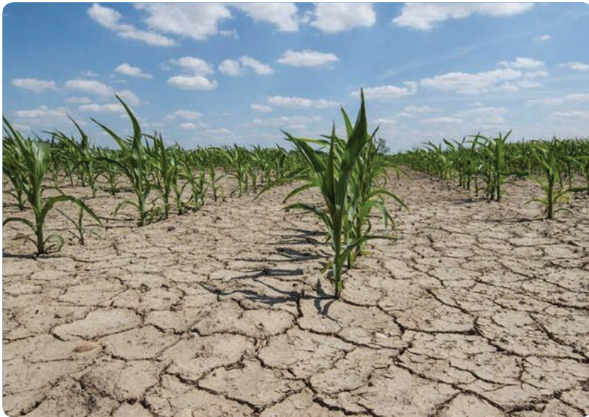
تحلیل پهنه ای بارندگی

بر اساس اطلاعات مرکز ملی اقلیم و مدیریت بحران خشکسالی سازمان هواشناسی کشور، مجموع پهنه ای بارندگی مازندران از ابتدای سال زراعی جاری تا پایان اردیبهشت امسال حدود ۴۳۵ میلی متر بوده است که در مقایسه با مشابه دوره آماری ۲۱ درصد یعنی ۱۱۶ میلی متر کاهش داشته است.