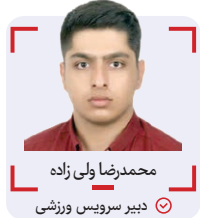
محمدرضا ولی زاده

اصلا ناصر و کزنش محال بود، گلبرگ مغرور آبی ها در دل تاریخ این مرز و بوم جاودان شد، چون از مردم بود و جز درد مردم دغدغه ای نداشت، روی اصولش پایبند بود و جز حفظ عزتش چیزی از نمی خواست، ناصر شاید از چشمها دور شد، اما اینبار برخلاف شعرها، آن کس که از دیده رفته بود، از دل نرفت و هرچه بیشتر گذشت، حجازی در قلب مردم ایران ماندگارتر شد چون مهرش از دل ایران بیرون نرفته بود، ناصر حجازی هرگز برای به دست آوردن موقعیت های خاص و ویژه، خود را با بازی های سیاسی و جناحی قاطی نکرد او همیشه و همیشه کنار مردم ماند در سخت ترین شرایط عزت نفس و غرور خود را حفظ کرد.