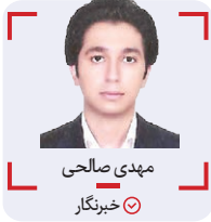
مهدی صالحی خبرنگار

از هفته بیست و سوم لیگ دسته یک، دو تیم گل‌ریحان البرز و بادران تهران به مصاف یکدیگر رفتند که این دیدار در نهایت با شکست دیگر برای تنها نماینده استان البرز به پایان رسید.