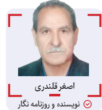
اسفغر قلندری نویسنده و روزنامه نگار