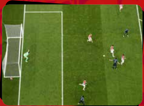
۱۰ فرانسه - کرواسی / دیدار فینال