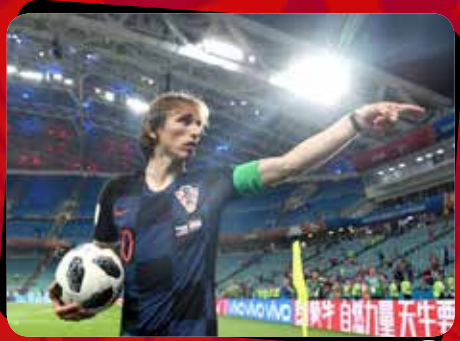
۵ کرواسی - روسیه / مرحله یک چهارم نهایی