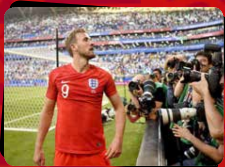
۹ انگلیس - سوئد / مرحله یک چهارم نهایی