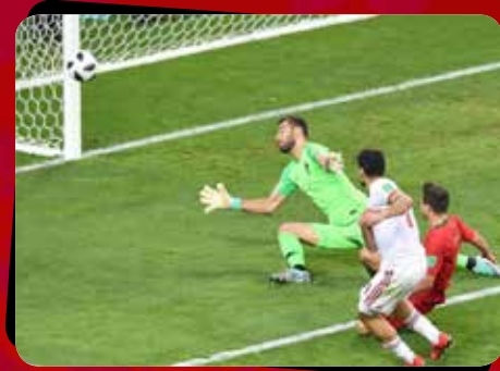
۱ ایران - پرتغال / مرحله گروهی گروه «B»