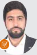
امیر حسین تیموری

توپ طلای فوتبال اروپا یا به عبارتی جهان، مدت زیادی است که اعتبار سابقش را از دست داده و تبدیل به یک تشریفاتی بی مزه شده است. در ۱۰ سال گذشته این عنوان تنها بین دو اسم تقسیم شده است. پنج بار «کریستیانو رونالدو» و ۵ بار نیز «لیونل مسی»، رقیب همیشگی اش. آخرین فردی که خارج از دوپولی تکراری مسی - رونالدو این عنوان را بدست آورده است، «یکاردو کاکا» است که اکنون فوتبالش به پایان رسیده و بازنشسته شده است. البته که مسی و رونالدو در ۱۰ سال گذشته در بالاترین سطح ممکن بازی کرده اند و گاهی بسیار دست نیافتنی بوده اند اما نمونه های بارزی هم از دخالت های سیاسی و تبلیغاتی در انتخاب آن ها به عنوان برنده وجود داشته است.