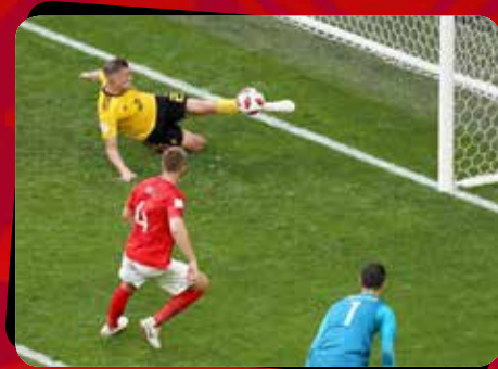
۶ بلژیک - انگلیس / دیدار رده بندی

روزنامه «دنیای هوادار» ۱۰ عکس جام را برگزیده است. فارغ از نتایج، در انتخاب این عکس ها صرفاً به جنجال و محتوا و مفهوم آن ها توجه شده است. در این مسابقه شما مخاطبان عزیز دنیای هوادار می توانید بهترین تیتراژی که برای هر یک از عکس ها را در نظر دارید به آیدی کانال تلگرامی و اینستاگرامی ما بفرستید. در نهایت بهترین تیتراژ انتخاب شده و به ۳ نفر از برندگان یک عدد «تبلت» اهدا خواهد شد و در شماره مورد نظر از تیتراژ خودشان در روزنامه استفاده خواهد شد. مهلت شرکت در این مسابقه تا پایان یکشنبه هفته آتی برابر با ۳۱ مرداد ماه می باشد.