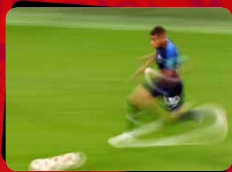
۷ آرژانتین - فرانسه / مرحله یک هشتم نهایی