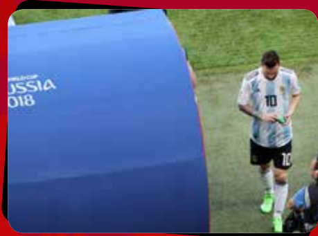
۲ آرژانتین - فرانسه / مرحله یک هشتم نهایی