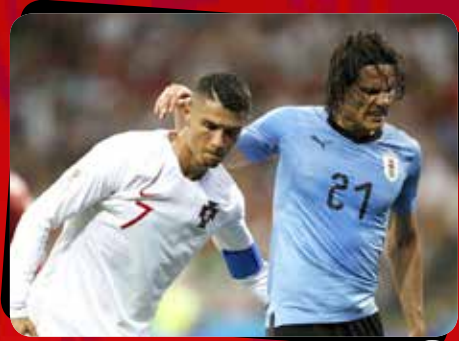
۳ پرتغال - اروگوئه / مرحله یک هشتم نهایی