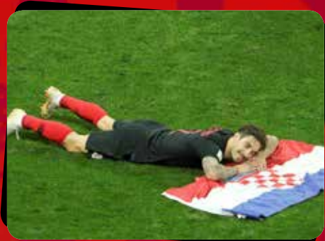
۸ انگلیس - کرواسی / مرحله نیمه نهایی