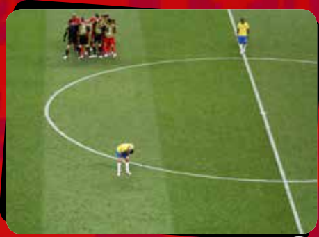
۴ برزیل - بلژیک / مرحله یک چهارم نهایی