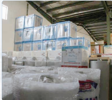
قاچاق را فراهم کنیم و مردم نیز می بایست با خریدن کالاهای فاقد اصالت و قاچاق در ریشه کنی پدیده قاچاق مشارکت کنند.

فرمانده انتظامی استان البرز، افزود: در بازدید از این انبار ۱۹۰ دستگاه لوازم خانگی قاچاق شامل: جارو برقی، پلوپز، آبمیوه گیری و... کشف شد.