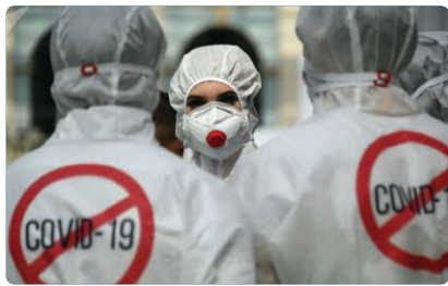
این تهدید را هم باید کسب بنامیم. صحبت جدیدی نیست، درخصوص شرایط قمر در عقرب گلریحان زیاد نوشتیم و این روزهای تیره و تار را از چندی پیش برای این تیم و مدیران تحلیلیگرش پیش بینی می کردیم، اما بهتر است مدیران تیم بازی جدیدشان را زودتر تمام کنند زیرا این نوع مدیریت پوپولیستی و شعارگرا دیگر برای مردم استان البرز نخنما شده است و برای فرار از واقعیت بهتر است، راه دیگری را پیدا کنند.

وی گفت: عمده تخلفات این واحدهای متخلف عرضه خارج از شبکه، گرانفروشی و عدم درج قیمت بوده است.