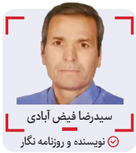
سیدرضا فیض آبادی نویسنده و روزنامه نگار