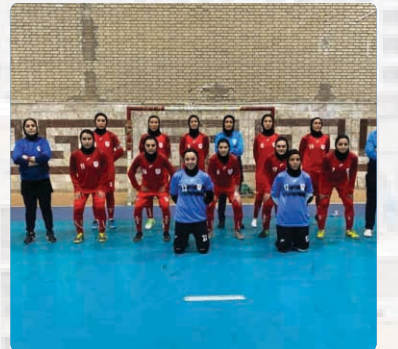
رئیس هیات فوتبال شهرستان فردیس با اشاره به برتری هشت بر صفر تیم فوتسال نصر بانوان این شهرستان در لیگ دسته یک فوتسال کشور مقابل تیم تبریز، گفت:

وی افزود: توسعه فوتبال و فوتسال در حوزه بانوان و چشم انداز ما در هیات فوتبال تشکیل یک تیم برتر و منتخب از بانوان بود تا برای شرکت در رقابت های استانی و کشوری حضور داشته باشند که این مهم با