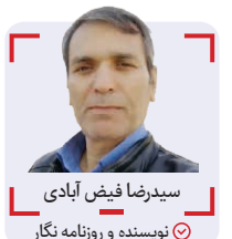
سیدرضا فیض آبادی نویسنده و روزنامه نگار