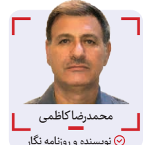
محمد رضا کاظمی نویسنده و روزنامه نگار