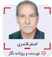
اصغر قلندری نویسنده و روزنامه نگار