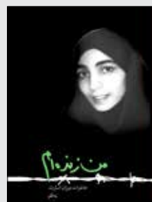
من زنده ام

«بی در بی صدای ضربه های همسایه ها (دکترها و مهندسان) را بر دیوار سلول می شنیدم که با نگرانی می پرسیدند: چرا جواب نمی دهی؟ می خواستم بگویم مردمان شلوع است و سرگرم سرندمان هستیم!»