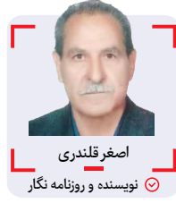
اصغر قلندری نویسنده و روزنامه نگار

در ۲۶ اردیبهشت سال ۱۳۸۶ قبل از دیدار تیم های پرسپولیس تهران و سپاهان اصفهان از هفته آخر نهمین لیگ برتر، از سوی جامعه ورزش، باشگاه فرهنگی ورزشی