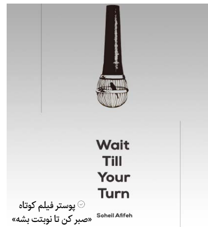
پوستر فیلم کوتاه «صبر کن تا نوبت بشه»