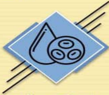
ایجاد لغته در اندام‌ها و اندام‌های تحتانی