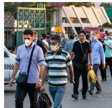
فرمانده قرارگاه عملیاتی مقابله با کرونا در البرز گفت: فردی با اشاره به پیشنهاد تعطیلی دو هفته‌ای تهران

خوبی اجرایی شود. این مسئول اضافه کرد: طبق بازرسی‌های صورت گرفته بیش از ۹۰ درصد واحدهای صنفی ای که مشمول این محدودیت‌های جدید شده‌اند، مصوبه ابلاغ شده را اجرایی می‌کنند. فردی با اشاره به پیشنهاد تعطیلی دو هفته‌ای تهران برای کاهش آمار مبتلایان به کرونا به ستاد ملی کشور ارائه شده، افزود: با توجه به اینکه برای اعمال محدودیت‌ها تهران و کرج با هم دیده می‌شود، اگر تهران تعطیل شود البرز هم تعطیل خواهد شد. فرمانده قرارگاه عملیاتی مقابله با کرونا در البرز گفت: اگر مردم پروتکل‌ها را رعایت نکنند و تعداد تلفات افزایش یابد چاره‌ای جز اعمال محدودیت‌های سختگیرانه‌تر نداریم چون جان مردم از همه چیز مهم‌تر است.