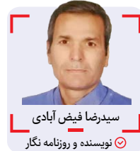
سیدرضا فیض‌آبادی نویسنده و روزنامه‌نگار

چهارنفر بودیم و تقریباً همراه و هم‌زبان و کمی هم‌همدل بودیم. نهار که می‌شد آقا مدیر و دو سه تا دبیر در دفتر و ما چهارنفر هم در کتابخانه سفره‌ها را باز می‌کردیم که معمولاً نان و ماست چکیده - تخم‌مرغ آب‌پز- طغیر و گاه دو سه تا کوکو سبب‌زمینی بود باهم می‌خوردیم. دو ساعت هم زمان داشتیم یعنی از ۱۲ تا ۲ که زنگ عصر می‌خورد و ساعت ۴ هم سوار دوچرخه به سمت فیض‌آباد.