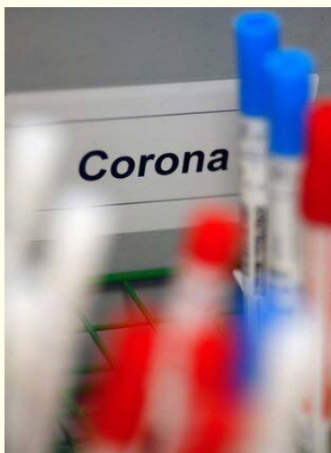
مبتلا خواهند شد بنابراین همه باید این ویروس را جدی بگیریم و تا تولید واکسن مؤثر آن به توصیه‌های بهداشتی عمل کنیم.