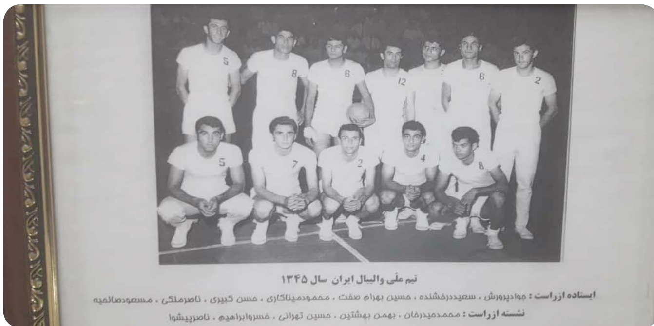
تیم ملی والیبال ایران سال ۱۳۴۵