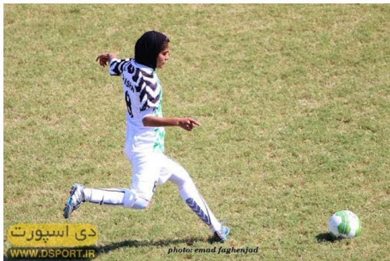
دی اسپورت WWW.DSPORT.IR