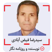
سیدرضا فیض آبادی نویسنده و روزنامه نگار

دیشب بعد از این همه بلایی که مدیران منتسب وزارت ورزش بر سر استقلال و پرسپولیس آوردند وزیر ورزش در حال اظهار فضل بود که این هفته سهام دو باشگاه در بورس مطرح می شود!