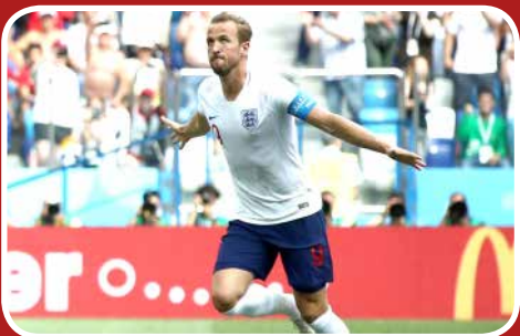
هت تریک هری کین در بازی انگلستان برابر پاناما