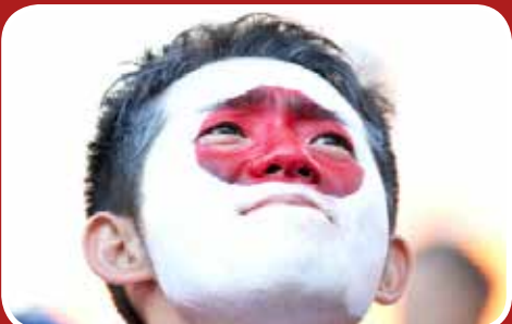
هوادر متعصب و نگران ژاپنی