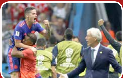
خوشحالی خامس رودریگز از پیروزی کلمبیا برابر لهستان