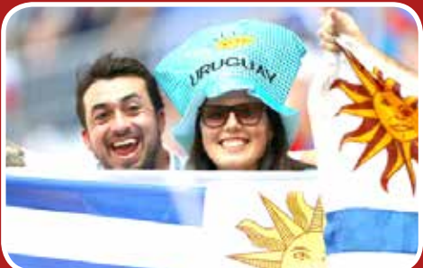
هوادران خوشحال تیم ملی اروگوئه