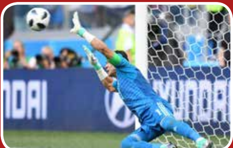
لحظه مهار پناستی عربستان توسط دروازه بان دوم مصر