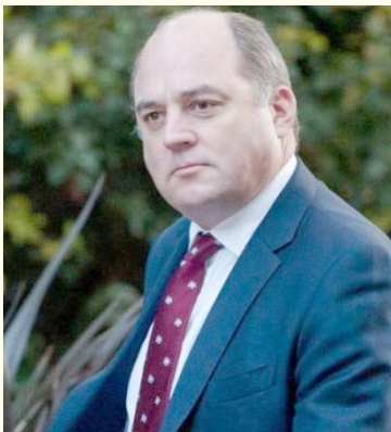
وزیر دفاع انگلیس که به تازگی با اعتراف به طلب قانونی ۴۰۰ میلیون پوندی ایران در پرونده قدیمی

تانک های «چیفتن» خیرساز شده است، تصریح کرد: کشورش از برجام حمایت می کند، چون این امر امکان بهبود اوضاع در خلیج فارس را فراهم می کند. به گزارش «دنیای هوادار»، «بن والاس» خاطر با بیان اینکه برای تضمین تداوم تجارت از طریق تنگه هرمز باید از قوانین بین المللی پیروی، خاطر نشان کرد: استمرار تردد آزاد در تنگه هرمز برای انگلیس و تمام اروپا در اولویت است.