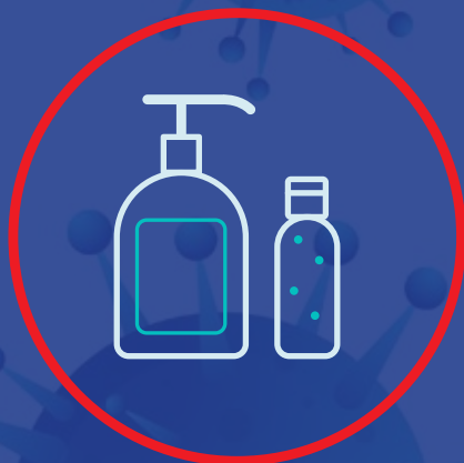
استفاده از پد الکلی و زل و الکل برای ضد عفونی