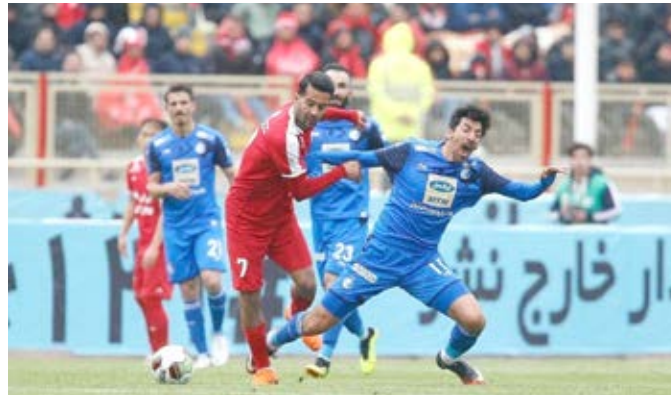
انصاف نیست که زحمات ما هدر برود

همین حالا اگر فدراسیون قرص و محکم پاسخ مدیرعامل تراکتور را ندهد و حتی بابت حرف‌های او را محروم و جریمه نکند فردا بهترین بهانه دست هواداران تراکتور است تا در کانال‌ها و سایت‌های مختلف به سمت داور و فدراسیون حمله ور شوند. حقیقتا بدعت نامیمونی را فدراسیون وقتی بنا نهاد که برای قضاوت دربی نیمه نهایی جام حذفی ابتدا «رضا کرمانشاهی» را اعلام کرد سپس آن ماجراها به وجود آمد! یقین داشته باشید که اگر داور آن بازی تغییر نمی‌کرد اتفاقات به گونه‌ای دیگری رقم می‌خورد.