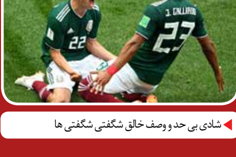
شادی بی حد و وصف خالق شگفتی شگفتی ها