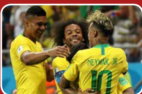
خوشحالی برزیلی ها پس از گل تماشایی کوتینیو