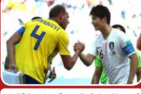
چشم بالامی هایی که با امید به شگفتی تا به میدان گذاشتند