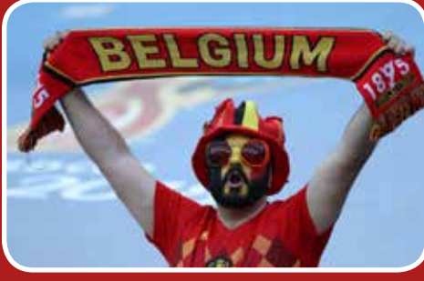
هوادران مجنون بلژیکی