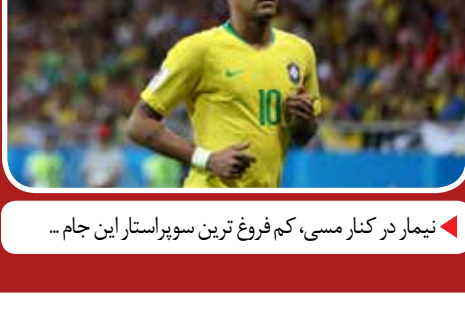
نیمار در کنار مسی، کم فروغ ترین سوپرستار این جام...