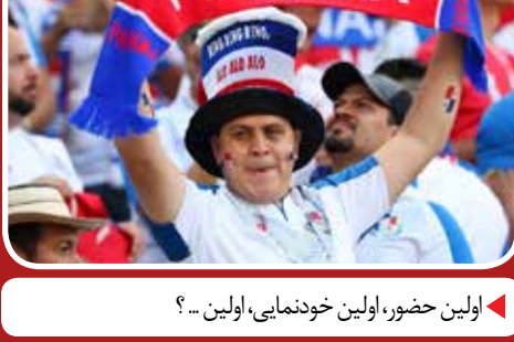
اولین حضور، اولین خودنمایی، اولین...؟