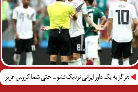
هرگز به یک داور ایرانی نزدیک نشو... حتی شما کروس عزیز