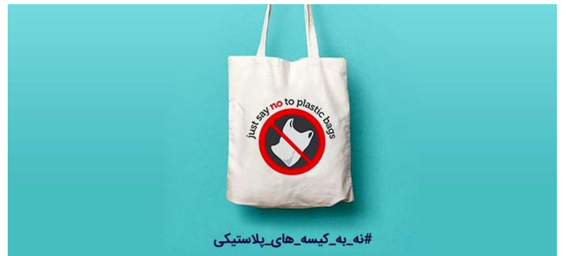
#نه به کیسه های پلاستیکی

کسانی که می خواهند از پلاستیک استفاده کنند هزینه ای را برای کیسه پلاستیکی پرداخت کنند. او با بیان اینکه کیسه های نازک در مقابل کیسه های ضخیم آسیب های بیشتری را برای محیط زیست به دنبال دارد و دیرتر در طبیعت تجزیه می شود، گفت: از این رو در این لایحه آورده شده است که تولید کیسه های پلاستیکی که جداره آن ها کمتر از ۲۵ میکرون است، ممنوع شود. جوهرچی ادامه داد: از دیگر پیشنهادات ما در لایحه کاهش مصرف پلاستیک این است که به صنایع تولید کیسه های پلاستیکی فرصتی دو تا پنج ساله داده شود تا بتوانند از مواد اولیه پلاستیک های زیست تخریب پذیر در تولید خود استفاده کنند. به گفته معاون دفتر مدیریت پسماند سازمان حفاظت محیط زیست یکی از مشکلات بزرگ در بحث مدیریت مصرف کیسه های پلاستیکی این است که برخی تولیدکنندگان آن پروانه بهره برداری ندارند و به همین دلیل دسترسی و نظارتی روی آن ها وجود ندارد. از این رو با وزارت صنعت هماهنگی های صورت گرفته است تا بتوان این مشکل را برطرف کرد.