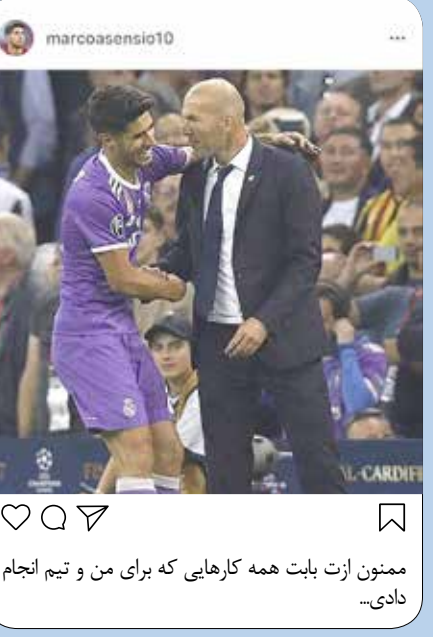
ممنون ازت بابت همه کارهایی که برای من و تیم انجام دادی...