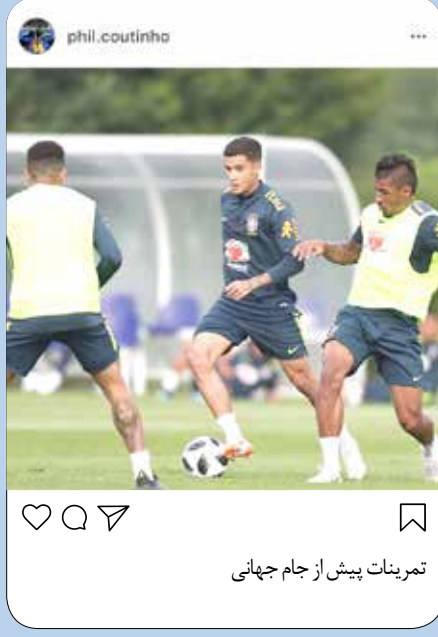
تمرینات پیش از جام جهانی