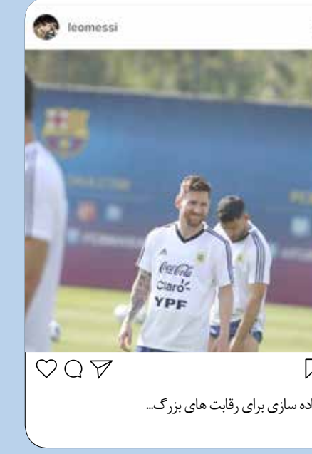
آماده سازی برای رقابت های بزرگ...