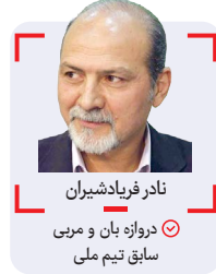
نادر فریادشیران دروازه بان و مربی سابق تیم ملی

تا عوامل اجرایی تیم! هزینه کیت های تشخیص کرونا از سیصد تا هشتصد هزار تومان برای هر نفر! عدم استفاده از نظرات، مدیران مربیان و حتی کادر پزشکی تیم ها و صادر کردن دستور از سازمان لیگ بدون در نظر گرفتن شرایط تیم ها از نظر مالی و بهداشتی - استرس و نگرانی مربیان و بازیکنان و خانواده هایشان به جهت احتمال ابتلا کرونا! - فضای نامناسب و کوچک رختکن ها و سرویس های بهداشتی ورزشگاه ها و... دوستان گرمی من سرانجام لیگ فوتبال ایران را خوش نمی بینم! دوستان و اساتید محترم؛ به نظر شما وقت آن نرسیده در یک فضای کاملا دموکراتیک و به دور از گرایش های فوتبالی و سرخابی در یک جلسه مشترک با حضور