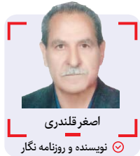
اصغر قلندری نویسنده و روزنامه نگار