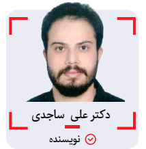
دکتر علی ساجدی نویسنده

فاصله حدود چهار کیلومتر است، یعنی با ماشین شخصی حدود بیست دقیقه. و اگر چراغ گردان و پلاک ویژه داشته باشید، شاید کمتر از یک ربع ساعت که خوب فاصله زیادی نیست برای عملیات گازانبری، یا برای حواله دادن به آینده. بله فاصله بهارستان تا پاستور را می گویم. اینکه در دایره قسمت ما نقطه تسلیمیم، به جای خود اما اینکه به صورت جمعی یک انتخابی بکنیم، درست یا غلط، و بعد آنچه انتخاب نکرده بودیم، یک طوری بشود که بشود سرنوشت محتوم، جای فکر دارد.