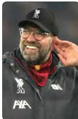
یک هوادار منچستر یونایتد با ارسال نامه ای برای یورگن کلوپ از وی درخواست کرد که نوار پیروزی های لیورپول قطع شود.

نبرید» یورگن کلوپ نیز در پاسخ به این هوادار یونایتد برای وی نوشت: «خست می خواهم از تو به خاطر نامه ای که برایم نوشتی قدرانی کنم. می دانم که هرگز برای من و لیورپول آرزوی موفقیت نداری و نخواهی داشت ولی همیشه آشنایی با جوانی مثل تو که عاشق فوتبال است و با من به همین دلیل تماس برقرار کرده، خوشحال کننده است. متأسفانه، این بار نمی توانم درخواست را برآورده کنم. همان طور که تو می خواهی لیورپول ببازد، کار من هم این است که هر کاری انجام دهم تا به لیورپول کمک کنم پیروز شود، چون میلیون ها نفر در سراسر دنیا به دنبال پیروزی لیورپول هستند. من واقعا نمی خواهم آن ها را ناامید کنم. اما از بخت خوب برای تو، ما پیش از این