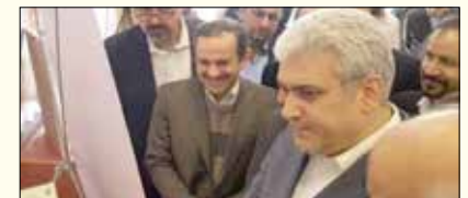
معاون علمی و فناوری ریاست جمهوری گفت: ایران در حوزه سلول های بنیادی در دو بخش علمی و تجاری مقام اول منطقه است.

سوزنا ستاری روز گذشته در حاشیه رونمایی از ۲۶ محصول دانش بنیان در حوزه سلول های بنیادی در جمع خبرنگاران افزود: موضوع تجاری سازی سلول های بنیادی مساله ای است که در این دولت به آن توجه ویژه ای شده که با همکاری وزارت بهداشت درمان و آموزش پزشکی و سازمان غذا و دارو در حال انجام است.