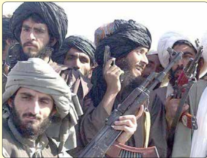
آمریکایی‌ها بوده‌اند و به کنسولگری ایران حمله کرده‌اند.

تصمیمات درستی در باب طالبان افغانستان بگیرد؛ چرا که آن‌ها در منطقه‌ای که آمریکا قطعاً هدف ما برای انتقام سخت هستند یک بازوی تاثیرگذار هستند و هرگز به دنبال دشمنی با ایران در این چند ساله نشان نداده اند و می‌خواهند روابط مستحکمی با ایران در مقابل آمریکا داشته باشند. ایران گرچه دولت ملی و مستقر افغانستان در کابل را به رسمیت می‌شناسد اما همه اهل فن در این باب می‌دانند که این دولت دست نشانده آمریکا فقط بر ۳۵ درصد افغانستان اعمال قدرت دارد و مابقی یا به دست طالبان اداره می‌شود و یا خطوط درگیری است و از آن مهم‌تر بدون حمایت آمریکا ۳ ماه هم نمی‌تواند بر سر قدرت بماند. آنچه خیر و صلاح ایران و ایران شهر و اسلام هست در همکاری نیروهایی است که به دنبال بیرون راندن آمریکا از منطقه با روش‌های مشروع هستند و آن‌هایی که به دنبال قدرت‌گیری در سایه آمریکا هستند با هر سابقه جهادی هم که باشند از منظر ما مردود باید شمرده شوند و خودمان را معطل این‌ها و نام‌هایشان ندانیم که این خیانتی بزرگ هم به ایران و هم به آرمان‌های بلند دینی و ایران شهری ماست.