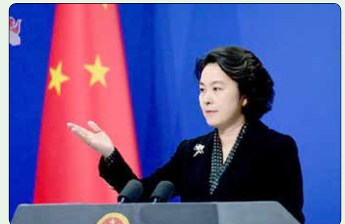
سخنگوی وزارت امور خارجه چین ضمن تاکید بر تلاش کشورش برای توقف شیوع ویروس کرونا افزود تاکنون ۱۶ تبعه خارجی در چین به کرونا مبتلا شده‌اند.

گیر کرونا استفاده خواهد کرد. سخنگوی وزارت خارجه چین تصریح کرد: حفاظت از جان و سلامتی شهروندان چینی و خارجی‌های مقیم چین از اولویت‌های دولت است. ویروس کرونا تاکنون در چین ۱۷ هزار و ۳۳۶ تن را مبتلا کرده و ۳۶۱ تن را هم به کام مرگ فرستاده است. آمارها حاکی است تاکنون ۵۱۶ تن نیز بعد از درمان ترخیص شده‌اند در حالی که ۲۱ هزار و ۵۵۸ تن دیگر هم به ابتلا به این ویروس مشکوک هستند. سخنگوی وزارت خارجه چین در ادامه با اشاره به تعلیق برخی از پروازهای خارجی به چین، تصریح کرد پاکستان که پروازهایش را برای چند روز تعلیق کرده بود امروز آنها را از سر خواهد گرفت.