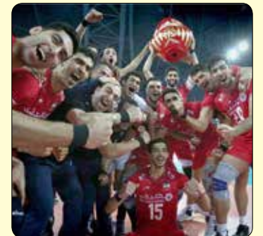
تیم ملی والیبال ایران با شکست میزبان رقابت های انتخابی المپیک برای دومین بار جواز حضور در المپیک را کسب کرد.

به گزارش «دنیای هوادار» به نقل از مهر، در مرحله فینال رقابت های انتخابی المپیک ۲۰۲۰ تیم ملی والیبال ایران از ساعت ۱۵:۳۰ دپروز یکشنبه مقابل تیم ملی چین، میزبان مسابقات