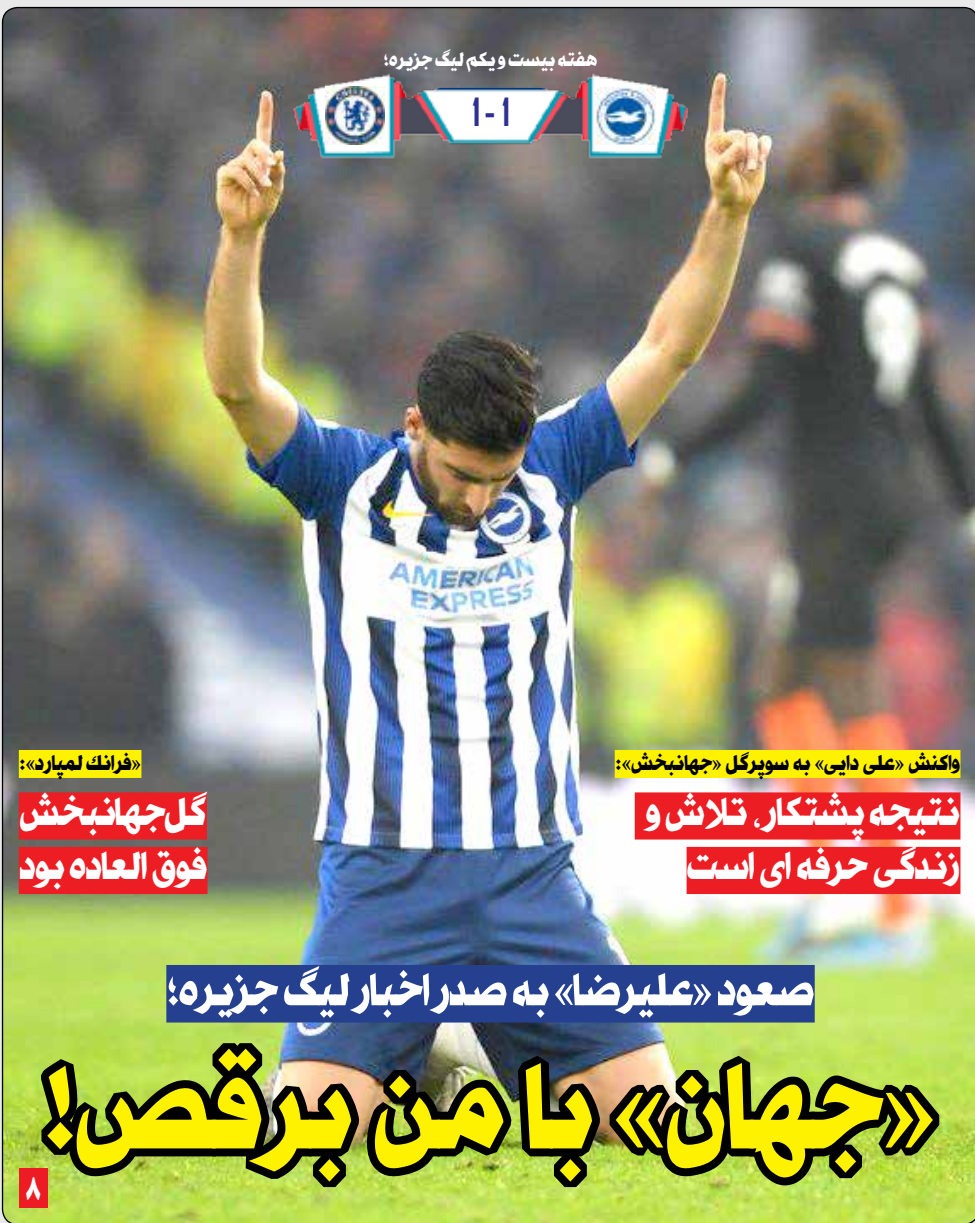
هفته بیست و یکم لیگ جزیره!