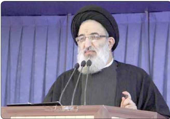
خط مقاومت با قدرت و توان بیشتر تارسیدن به اهداف بلند انقلاب اسلامی دنبال شود.

نماینده ولی فقیه در استان البرز و امام جمعه کرج طی پیامی انتصاب سردار اسماعیل قآنی را به فرماندهی نیروی قدس سپاه پاسداران انقلاب اسلامی تبریک گفت و افزود: حمایت سپاه پاسداران از خط مقاومت همواره دنبال خواهد شد.