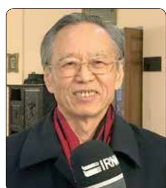
دیپلمات چینی و نائب‌رئیس انجمن دوستی چین و ایران با اشاره به مشکلاتی که یکجانبه‌گرایی آمریکا برای دو کشور ایجاد

کرده است. گفت: تمدن چین و ایران باید دست یکدیگر را بگیرند و با کمک همدیگر مشکلات پیش‌رو را حل کنند. به گزارش «دنیای هوادار» به نقل از ایرنا، «لیو جین تانگ» روز گذشته با انتقاد از یکجانبه‌گرایی آمریکا علیه تهران و پکن افزود: دو کشور اکنون نیز با هم به دنبال صلح، امنیت و سعادت مردم مردم خود و جهان هستند و در این مسیر گام بر می‌دارند. سفیر پیشین چین در تهران گفت: ایران یک کشور سرآمد است و خدمت بزرگی به تمدن و تاریخ بشریت کرده است و همواره هم رابطه خوب و دوستانه با چین داشته است. رئیس‌انجمن دوستی چین و اعراب با اشاره به بهره‌مندی دو کشور ایران و چین از روابط خوب