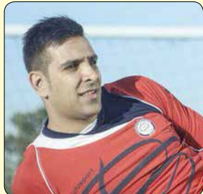
مراسم تشییع آن مرحوم متعاقباً اطلاع رسانی خواهد شد.